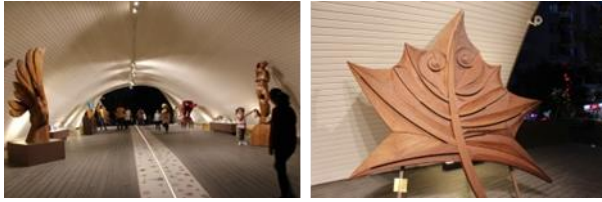
Resim 24, 25. Hamamyolu Sanat Köprüsü üzerinde sergilenen sanatsal objelerden görünüm

Tasarım prensiplerinden bir diğeri ise Odunpazarı Uluslararası Ahşap Heykel Festivali'nde ahşap sanatçıları tarafından tasarlanan heykellerin proje alanında sergilenmesidir. Heykellerin konseptte uygun alanlarda sergilenmesinin, alana farklı bir hareket katacağı öngörülmüştür (Şekil [24], [25]).