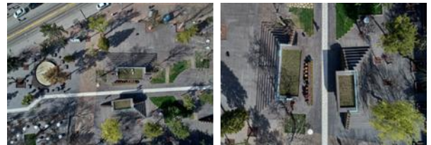
Resim 4, 5. Kentsel dokunun sürdürülebilirliği ve hareketli buluşma alanlarından görünüşler (URL- 1)