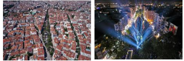
Resim 1, 2. Hamamyolu Sokağının gece ve gündüz görünüşleri (URL- 1)

Eskişehir Odunpazarı'nın en önemli kentsel alanlarından biri olan Hamamyolu Sokağında Yazgan Mimarlık Ofisi tarafından tasarlanan "Hamamyolu Urban Deck (Hamamyolu Kentsel Platform)", yoğun kent dokusunun içinde var olan caddenin canlandırılmasına yönelik davetkar bir bakış açısı sağlamaktadır. Geri dönüştürülebilir ahşap kompozit kullanılarak oluşturulan peyzaj elemanlarından, su sistemlerinden ve yoğun bitki dokusundan oluşan bu 'yeşil yaya aksı', Odunpazarı'ndan Porsuk Nehri'ne doğru uzanan modern ve hareketli buluşma alanları yaratmaktadır (Şekil [1], [2], [3], [4], [5], [6], [7]).