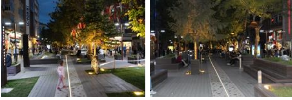
Resim 8, 9. Odunpazarı Sokağı ve Porsuk Nehri arasında kesintisiz sunulan yaya ulaşımından görüntüler

Çanak Havuzu ve Kitap Fuarı Alanı (zon 3), Kafe-Oturma Alanı (zon 4), İbrahim Karaoğlu Caddesi Üst Geçiti ve Müze Alanı (zon 5), Çocuk Oyun ve Sergi Alanı (zon 6), Buhar Havuzu ve Oturma Alanı (zon 7), Dikey Aydınlatmalı Geçiş Alanı (zon 8) olarak ziyaretçilerle buluşmaktadır. "Hamamyolu Urban Deck (Hamamyolu Kentsel Platform)" projesinde bütün bu zonlar, 10 temel tasarım prensibine dayandırılarak oluşturulmuştur. İlk prensip, Hamamyolu Caddesinin Odunpazarı ve Porsuk nehri arasındaki bağlantıyı kentsel ölçekte güçlendirmek üzerine kurulmuştur. Projede, Odunpazarı'nın tarihi dokusu Porsuk Nehrine kesintisiz bir yaya aksı ile bağlanmıştır (Şekil [8], [9]).