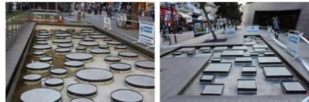
Resim 6, 7. Yer düzleminde sürpriz mekan oluşumlarından görünüşler

"Hamamyolu Urban Deck", belirli temalara dayanan 8 ana zondan oluşmaktadır. Esin kaynakları, buldukları tarihi doku ve sosyal bağlamdan alan bu zonlar sırasıyla; Hicri Sezen Parkı Bağlantı Yolu (zon 1), Alaaddin Parkı (zon 2),