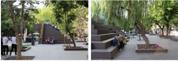
Resim 10, 11. Mevcut yeşil doku ve yeni eklenen ağaçlardan görüntüler

İkinci olarak, tarihi dokuya yeniden hayat verilerek yeni bir yeşil kuşak oluşturmak hedeflenmiştir. Hicri Sezen ve Alaaddin Parklarının mevcut yeşilleri ile Porsuk Nehri kıyısındaki yeşil alanlar, Hamamyolu Caddesinde bulunan çok yıllık ağaçlara ek olarak küp şekli verilmiş ıhlamur ağaçları, çalılar, sarmaşıklar, yer örtücüler ve çim alanlar ile birbirlerine bağlanmıştır (Şekil [10], [11]).