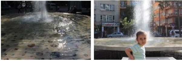
Resim 22, 23. Farklı formlardaki havuzlardan görünüm

Kentsel platformda, ziyaretçilerin dinlenmesi için su elemanlarının kullanımına önem verilmiştir. Projede suyun farklı formlarda ve ölçülerde hareketlendirilmesiyle tasarlanan çanak havuzu, taş havuzu, buhar havuzu ve bank havuzu olmak üzere 4 farklı tip havuz tasarlanmıştır (Şekil [22], [23]).