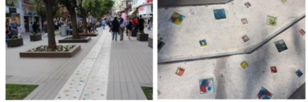
Resim 14, 15. El yapımı camların gömülü olduğu yaya aksından görüntüler

camların gömülü olduğu beyaz çimentodan oluşan bir yaya aksıdır. Odunpazarı cam atölyelerinde üretilen el yapımı camların bu aksa entegre edilmesi öngörülmüştür (Şekil [14], [15]).