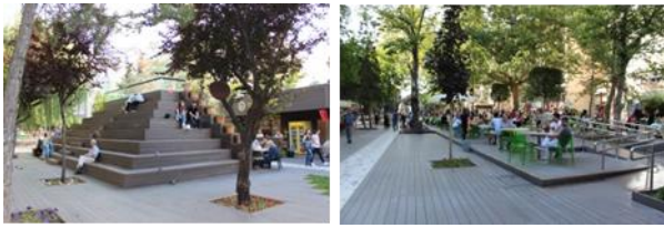
Resim 12, 13. Geri dönüştürülebilir ahşap kompozit malzemenin farklı kullanımlarından görüntüler

Bir diğer prensip, geri dönüştürülebilir ahşap kompozit kullanılarak tasarlanmış kesintisiz bir kentsel platform oluşturmaktır. Topoğrafya ön plana alınarak, üç boyutlu kurgu ile planlanan bu kentsel platform; köprüyü, kafeleri, platformları, kitap fuarını, havuzları ve oturma alanlarını oluşturmaktadır. Ziyaretçilerin sadece yatayda değil; üst geçitleri ve rampaları ile düşeyde de hareket etmelerini sağlayarak, onların kent dokusunu farklı bir bakış açısıyla deneyimlemeleri hedeflenmiştir (Şekil [12], [13]).