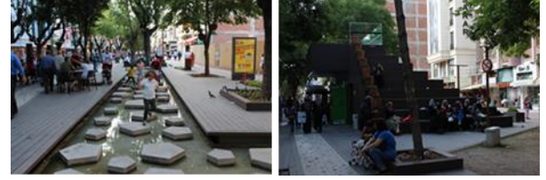
Resim 16, 17. Geçiş alanlarını vurgulayan yer döşemelerindeki renk farklılıklarından görüntüler

Proje alanının bu kentsel platformla olan ilişkisi, var olan pasajların ve çevresinde bulunan sokakların referans alındığı kentsel bağlantılar ile sağlanmıştır. Bu geçiş alanları, pasaj girişlerinde cam gömülü beyaz çimento ile vurgulanırken, sokaklar ile olan bağlantılarda ahşap kompozitlerin ve yer döşemelerinin renklerinin değiştirilmesiyle öne çıkarılmıştır (Şekil [16], [17]).