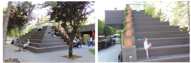
Resim 18, 19. Basamaklı çatılı oturma imkanı veren kafelerden görüntüler

Alanda ön plana çıkarılan bir diğer konu ise kafe alanlarının yoğunluğunun ve çeşitliliğinin artırılmasıdır. Kafeler; meydanlı kafeler, platform kafeleri, köprü altında bulunan kafeler ve küçük kafeler olarak çeşitlendirilmiştir. Platformun basamaklanmasıyla oluşan bu kafelerin çatılarında farklı yer örtücülerden oluşan bitki havuzları tasarlanmıştır. Ayrıca basamaklanmış bölümlerde ziyaretçilere oturma imkanı sağlayarak oturma alanlarını arttırmak hedeflenmiştir (Şekil [18], [19]).