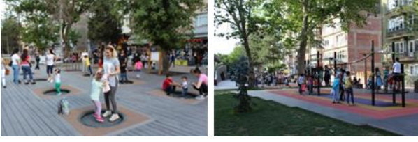
Resim 20, 21. Alternatifli sunulan oyun mekanlarından görünüm

Kentsel platformda, ziyaretçilerin dinlenmesi için su elemanlarının kullanımına önem verilmiştir. Projede suyun farklı formlarda ve ölçülerde hareketlendirilmesiyle tasarlanan çanak havuzu, taş havuzu, buhar havuzu ve bank havuzu olmak üzere 4 farklı tip havuz tasarlanmıştır (Şekil [22], [23]).