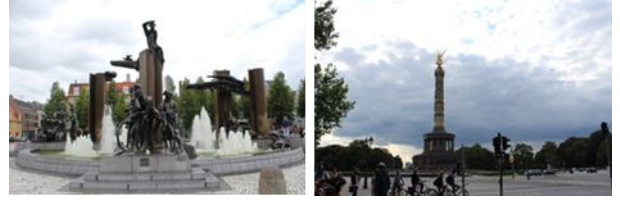
Resim. 3, 4. Burugge ve Berlin'de yer alan anıtsal yerleştirme görüntüleri

Yerleştirme sanatı olarak bilinen enstalasyon basit veya kompleks çok farklı formlarda ortaya çıkmaktadır. Sanatçılar ürettiği enstalasyonun anlamını açığa çıkarmak ve enstalasyonu aktive etmek için izleyicinin katılımını şart koşan çalışmalar üretmiştir. Enstalasyonlar galerilerde yer alabileceği gibi; kamusal alanda da dijital tabanlı, elektronik tabanlı, web tabanlı da olabilen sınırsız olanaklarda; sanatçının konsept ve amacına bağlı olarak şekillenmektedir (Şekil [5], [6], [7], [8]).