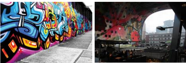
Resim. 15, 16. Rotterdam modern grafiti ve iç mekan yüzey boyama örneklerinden görüntüler (F. Şahin Arşivi)

Yüzey boyama olarak genel sınıflandırılan kamusal sanat uygulamaları kentsel mekanın yer döşemesinde, duvarlarında, bina cephelerinde yapılan boyamaları kapsamaktadır. Kamusal yüzeylere yapılan illegal, muhalif nitelikli müdahaleler ise grafiti olarak tanımlanır. Yakın geçmişte grafiti, azınlıkların bulunduğu, çete ve yeraltı kültürlerinin yer aldığı bölgelerde yaygın olarak kullanılmış, adı bu kesimle özdeşleşmiş bir kent sanatıdır. Seslerini duyurma, varlıklarını gösterme amacıyla grafitiyi bir dil olarak benimseyen azınlık gençler, müziğinde (hip-hop, rap, punk vb.) etkisiyle başkaldırıyı sokaklara taşımışlardır [7]. Bu grupların birçoğu yüzey boyama çalışmalarını toplumla birlikte gerçekleştirmiş, her şehrin etnik sorunları dile getirilmiştir. Toplumsal içerikli bu kamusal sanat çalışması aynı zamanda “yeni tip kamusal sanatın” doğuşuna neden olmuştur (Şekil [15], [16], [17], [18]).