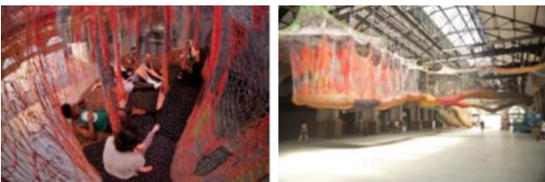
Resim. 29, 30. Viyana ve Odessa açık alan oyun örneklerinden görünüm

Kamusal alandaki oyun içerikli sanat etkinliklerinin kökeni olarak 1950'lerdeki ludik sanat anlayışı gösterilebilir. İkinci Dünya Savaşı'ndan sonraki dönemde çağın toplumsal ekonomik, bilimsel, politik gerçeklerinin toplumda yarattığı bunalımlar sanatçıyı oyun-sanat türüne itmiş; sanatı insan ve toplumun mutluluğunu hedefleyen bireysel veya toplumsal protestolar olarak ele almıştır. Hollandalı filozof Huizinga çağın insanını "Oyun Oynayan Mahluk" olarak tanımlamıştır [9]. Hollandalı filozofun bu tanımlaması çağın sanatının hareket kaynağı olmuştur. Ludik sanat, insanın mutluluğuna yönelmiş, insanlar için yaşama sevinci oluşturmayı önceliği yapmış ve "Sanat bir şenliktir" sloganını benimsemiştir. Kamusal alanda düzenlenen oyun içerikli sanat pratikleri, izleyiciyi etkinliğin bir parçası haline getirmekte ve onu oyuncu olarak konumlamaktadır. Bu tarz düzenlemeler, izleyiciyi oyunun bir parçası haline getirip izleyicinin kamusal mekanla kurduğu rutin ilişkinin dışına çıkmasını ve farklı deneyimler yaşamasını sağlar (Şekil [29], [30], [31], [32]).