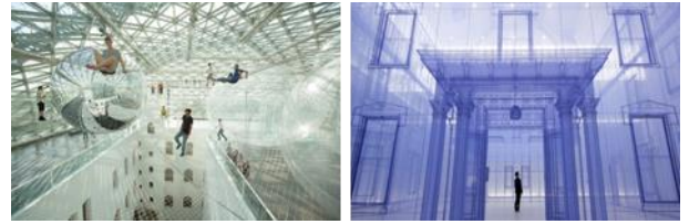
Resim. 7, 8. Standehaus Müzesinin orta alanının 25 metre üzerinde asılı duran büyük bir kafes yapı ve sanatçının daha önce yaşadığı 2 ev 1/1 ölçekte iç içe yer alan enstalasyonlardan görüntümler