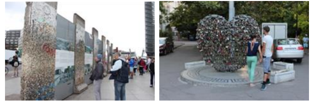
Resim. 21, 22. Berlin ve Odessa açık alan sergi örneklerinden görüntüler