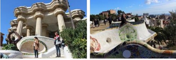
Resim. 11, 12. Barcelona Güell Parkında Gaudi tarafından tasarlanan kentsel mobilyalardan görüntüler