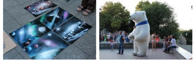
Resim. 31, 32. Prag ve Odessa açık alan oyun örneklerinden görünüm (F. Şahin Arşivi)