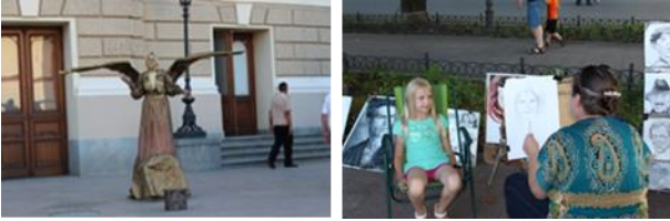
Resim. 27, 28. Viyana ve Odessa açık alan performans (canlı heykel, portre) örneklerinden görünüm