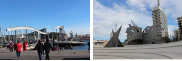
Resim. 13, 14. Barcelona iyileştirilen liman bölgesinde yer alan kentsel mobilyalardan görüntüler