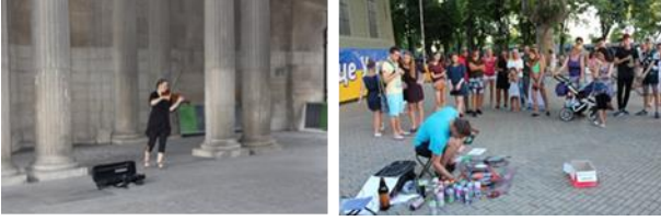
Resim. 25, 26. Paris ve Odessa açık alan performans (müzik, boyama) örneklerinden görünüm