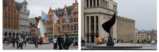
Resim. 1, 2. Burugge ve Brüksel'de yer alan kent odak noktasını güçlendiren ve kimlik oluşturan yerleştirme görüntüleri (F. Şahin Arşivi)

Mimari yüzeylerde, yani iç ve dış duvarlarda, serbest duran perde duvar ve meydanlarda, parklarda, her türlü açık alanda, geleneksel resim ve heykel de şehir mekanında bir bakıma yeni soyut biçimleri ile yaşamaya devam etmektedir. Gelişmiş ülkelerin kentlerinde kamusal sanatın en sık rastlanan örneği, temsili binalar ya da yüksek büro blokları önündeki plazalarda görülen modernist ve soyut heykel çalışmalarıdır [6].