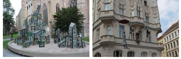
Resim. 19, 20. Burugge ve Prag açık alan sergi örneklerinden görüntüler

Günümüzde kentlerin sokak, cadde, meydan, park alanları sanatçıların galeri ve müze dışındaki sergileme alanları haline gelmiştir. Açık alan sergileri de bu alanlarda yapılan geçici fotoğraf, enstalasyon, ışık, dijital pano vs. gibi sergileri kapsar. Bu sergiler toplumun sanata yaklaşması, sanat konusunda gelişmesi, sanatçının da kendisini tanıtması açısından önem taşır. Avrupa'nın birçok büyük kentinde kent parklarında ya da önemli cadde, plazalarında çağdaş sanat müzelerinin, galerilerin ya da sanat festivallerinin girişimleri ile küratörler eşliğinde kamusal alanda yer bulmaktadır (Şekil [19], [20], [21], [22]).