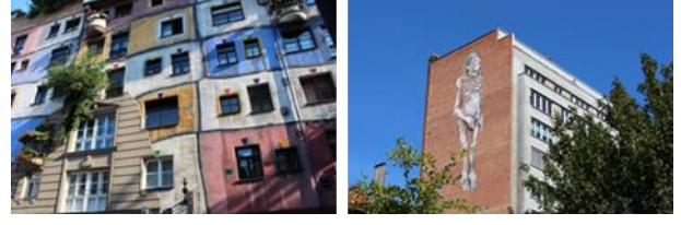
Resim. 17, 18. Viyana ve Brüksel duvar yüzeyi boyama örneklerinden görüntüler