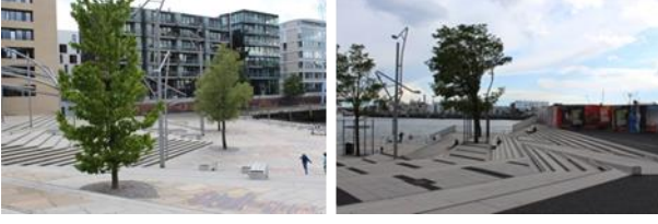
Resim. 9, 10. Hamburg Haffencity kentsel dönüşüm kapsamında yenilen kentsel mobilyalardan görüntüler