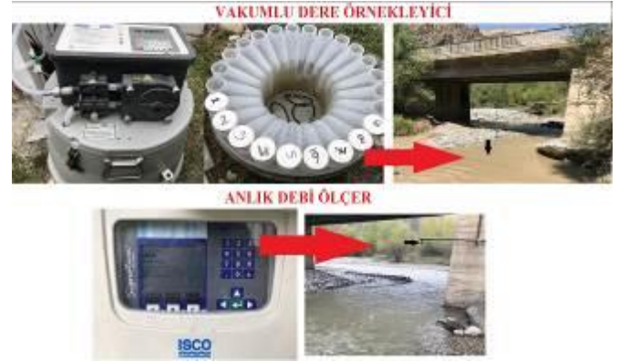
Şekil 2 Sediment İstasyonu

Askıda katı madde ölçümü: Çoruh Nehri Havzası Rehabilitasyon Projesi kapsamında Olur Mikrohavzası dere çıkışına kurulan sediment istasyonundan faydalanılmıştır. Sediment istasyonu içerisinde bulunan; dereden her gün 250 ml numune alan vakum cihazı ve beraberinde lazer doppler cihazı dere yüksekliğine bağlı anlık debi verilerini m 3 /s biriminde elde etmektedir (Şekil 2).