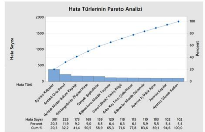
Şekil 1: pareto analizi

Tablo 1'de gösterilen hatalara ait pareto analizi şekil 1'de verilmektedir.