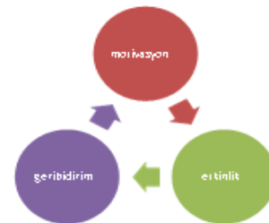
Şekil 3 Etkinlik Döngüsü