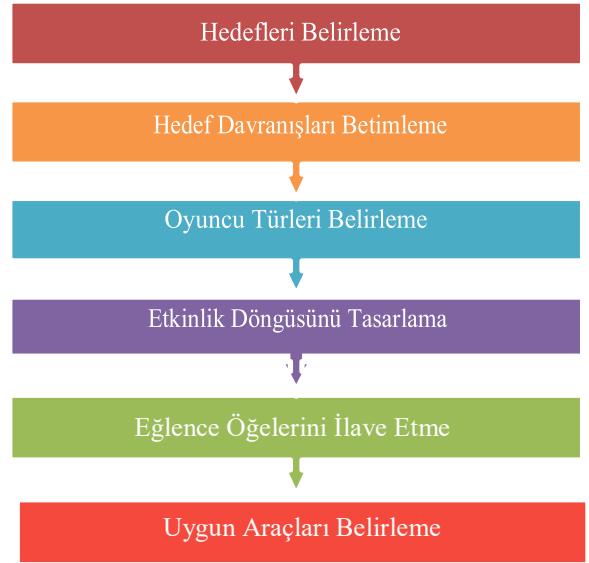
Şekil 2 D6 Oyunlaştırma Tasarım Modeli

durumlar ve amaçlar için de kullanılmıştır. Werbach ve Hunter'a ait D6 Oyunlaştırma Tasarım Modeli Şekil 2'de görüldüğü gibidir.