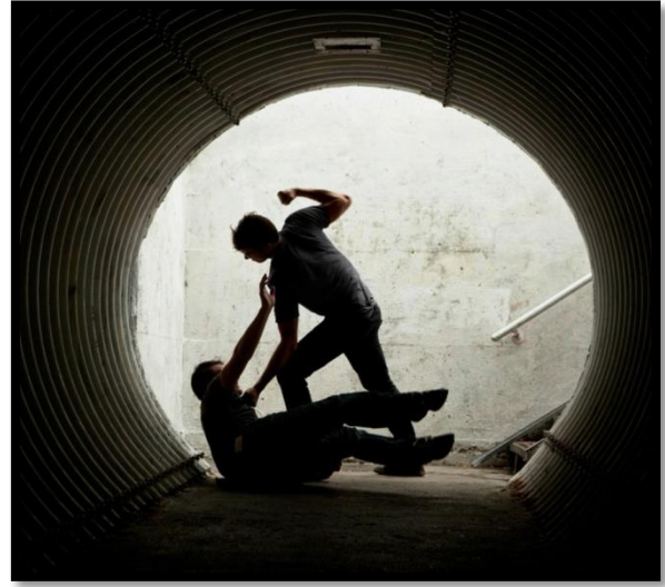
Şekil 1: Kırıyıcı-yıkıcı saldırganlık

Berkowitz ise bu davranış biçimini düşmanca ve araçsal saldırganlık olarak iki şekilde incelemiştir. Düşmanca saldırganlık, tahrik, öfke içeren ve zarar verme amaçlı saldırganlık tipidir. Araçsal saldırganlık ise amaçlar ve ihtiyaçlar kaynaklı olarak ortaya çıkmaktadır[6].