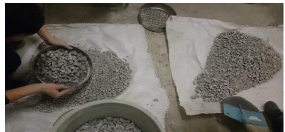
Şekil 1. Geri dönüşüm agregalarının elekler yardımı ile gruplara ayrılması

Kalker esaslı kıırma taş agregası (KA) ve C30 betonun 28 günlük basınç deneyinden sonar geri kazanılmış agregaları üç grup (0-4 mm, 4-11,2 mm ve 11,2-22,4 mm) şeklinde beton üretiminde kullanılmıştır.