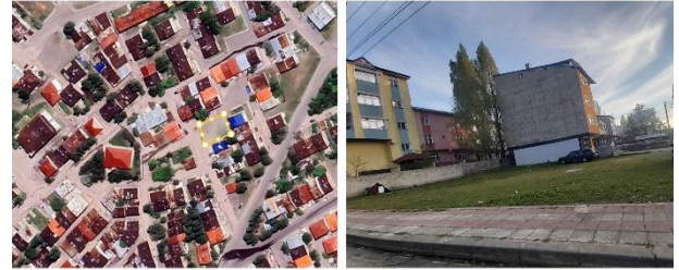
Şekil 7. Alan-2 Mevcut durum

Mevcut Durum: Alan Palandöken ilçesi, Kazım Yurdalan Mahallesi'nde yer alan bu açık alan, 379,49 m 2 büyüklüğünde düşük yoğunluklu konut dokusu içinde, yarı-kamusal nitelikli bir boşluktur (Şekil 7).