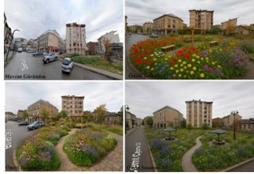
Şekil 6. Alan-II Kaotik bahçe tasarım önerileri

sağlamaktadır. Tasarımın informal karakteri, keşif duygusunu teşvik ederken, aynı zamanda yavaşlatılmış bir mekânsal deneyim sunar. Bu bağlamda kaos bahçesi, kentsel düzenin baskın yapısına karşı estetik ve işlevsel bir alternatif olarak öne çıkmaktadır. (Şekil 6).