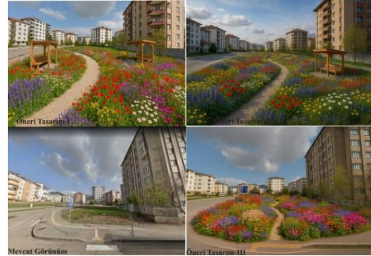
Şekil 4. Alan-1 Kaotik bahçe tasarım önerileri

Sosyal ve Kullanıcı Deneyimi Perspektifi: Alanda renkli, düzensiz ve doğala yakın bitki örtüsü, stres azaltıcı etkiler yaratmaktadır. Özellikle kentte doğayla temasın sınırlı olduğu bağlamlarda bu tür bahçeler "mikro-terapi" alanı işlevi görebilir. Ayrıca görsel zenginlik sayesinde psikolojik rahatlama, mekânsal farkındalık ve estetik doyum gibi insani yararlar da üretilmiştir (Şekil 4).