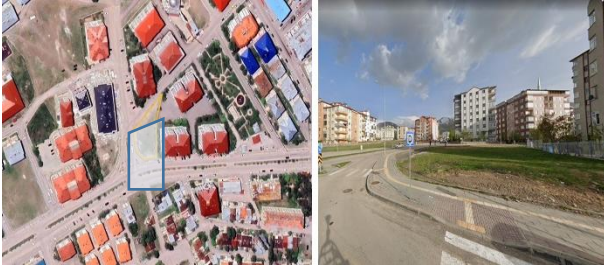
Şekil 3. Alan-1 Mevcut durum

Mevcut Durum: Yaklaşık 1.418,44 m 2 'lik bu alan, Palandöken ilçesi Yunus Emre Mahallesi'nde, birbirine paralel yerleşmiş konut bloklarının arasında konumlanmıştır (Şekil 3).