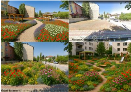
Şekil 8. Alan-III Kaotik bahçe tasarım önerileri

Sosyal ve Kullanıcı Deneyimi Perspektifi: Bu küçük ölçekli kaos bahçesi, mahalle sakinlerine doğayla etkileşim kurabilecekleri, gözlem yapabilecekleri ve dinlenebilecekleri bir kamusal alan sunmaktadır. Oturma alanları, çocuklar için doğal oyun kurguları ve dar patikalar, kullanıcı deneyimini zenginleştirmektedir. Komşuluk ilişkilerini teşvik edecek ve kullanıcıların alanı sahiplenmesini sağlayacak bir "birlikte üretim" potansiyeli barındırmaktadır (Şekil 8).