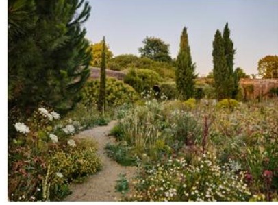
Şekil 1. Knepp Kalesi'ndeki vahşi bahçe, İngiltere [19]

planlama ölçeğinden mikro-mekânlara doğru inen bir bakışla kaos bahçeciliği; kent içinde yok sayılan boşluklara yeni bir yaşam ve anlam yükleyerek, sürdürülebilir kent vizyonuna katkı sunar (Şekil 1). Bu yaklaşım, yalnızca doğanın değil, kentin de yeniden yabanlaştırılması anlamına gelir. Aynı zamanda mekânsal adalet, estetik çeşitlilik ve dirençli ekosistemler açısından da potansiyel taşımaktadır [19].