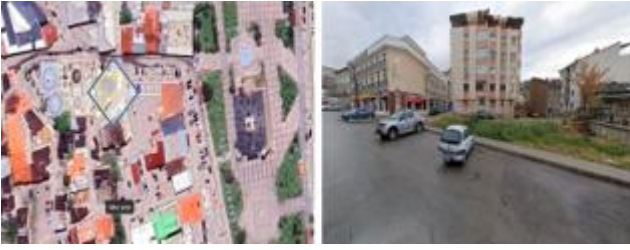
Şekil 5. Alan-2 Mevcut durum

Açık alan hem tarihî kimliği hem de günlük ticari hareketliliği nedeniyle yaya kullanımının yoğun olduğu bir odakta konumlanmıştır. Ancak bu potansiyel, mevcut durumda düzensiz yaya akışları, araç geçişleri, otopark kullanımı ve yeterli yeşil alan eksikliği nedeniyle boşa harcanmaktadır. Bu sebeple, alan bir "mikro kentsel boşluk" olarak değerlendirilmiş ve doğa temelli tasarımla yeniden ele alınmıştır.